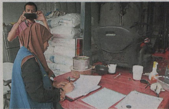
关业者。 执法官员发出查封通知给相