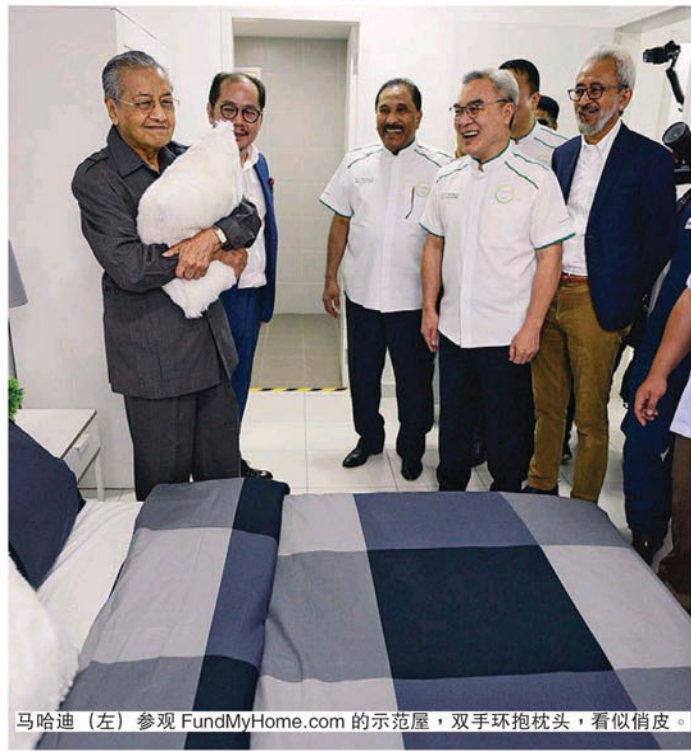
马哈迪(左)参观 FundMyHome.com 的示范屋，双手环抱枕头，看似俏皮。