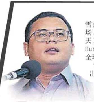
■ 阿米鲁丁指雪州政府计划发展梳邦机场，为国际水准的航天工业枢纽。

(瓜拉雪兰莪4日讯) 雪州政府计划发展梳邦机场，成为国际水准的航天工业枢纽 (Aerospace Hub)，藉此将雪州推介给全球。