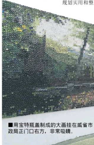
■用宝特瓶盖制成的大画挂在威省市政局正门口右方，非常吸睛。