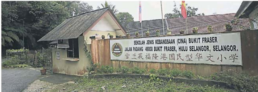
福隆港华小有逾70年历史,随着今年最后一位学生毕业,该校将正式关闭及迁往瓜拉冷岳县丽阳丰逸城。

小,不过随着多项综合发展项目的展开,未来人口的增长,有必要完善规划各源流学校,以满足各族的需要。