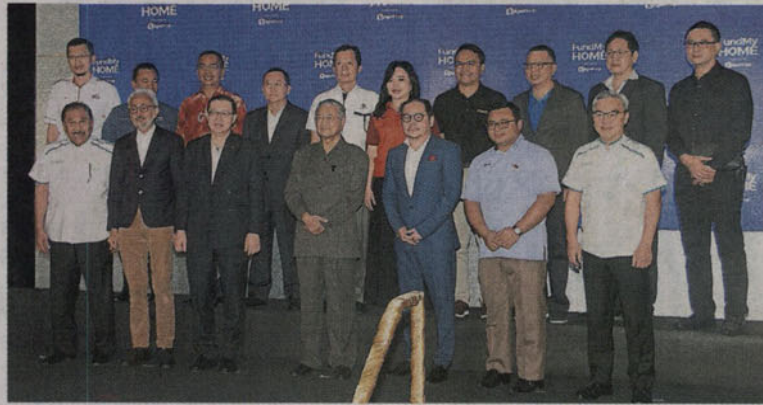
■拉昔（前排左起）、拉惹卡馬魯巴哈林、林冠英、馬哈迪、童貴旺、阿米魯丁以及劉啟盛在FundMyHome.com的產業眾籌推介禮后，連同參與計劃的發展商合影。

(士毛月4日訊) 首相敦馬哈迪為首個配合2019年財政預算案宣布的“產業眾籌”計劃的房屋計劃主持推展禮，購屋者只需支付房產價格的20%便可擁有房產，80%的余款則由投資者提供。