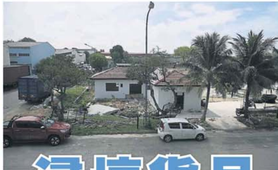
■水灾，造成他们损失。业者投诉对面工地未做好排水系统，以致排水不及引发