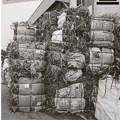
▲工厂内的洋垃圾堆得比人还高，数量不少。

(巴生4日讯)配合全国和雪州政府的脚步，巴生市议会如今也全力支持对抗洋垃圾厂，日前突击并取缔万津路黑水村的7间非法洋垃圾厂，查封及充公其中6间工厂的所有操作机械。