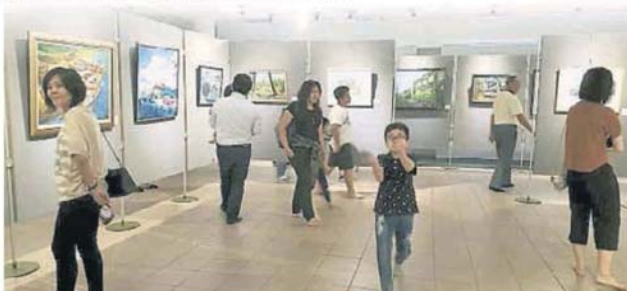
■ 本届画展共有60余副作品展出。