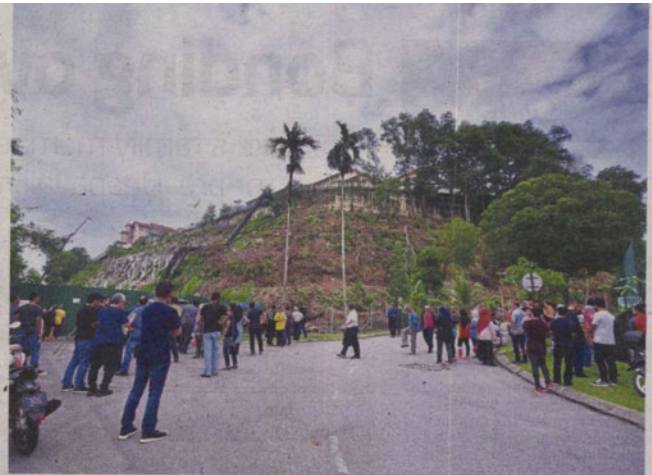
De Puncak Ukay residents in Ukay Perdana are concerned over the approved housing project that will take place on this steep hillslope in their neighbourhood.