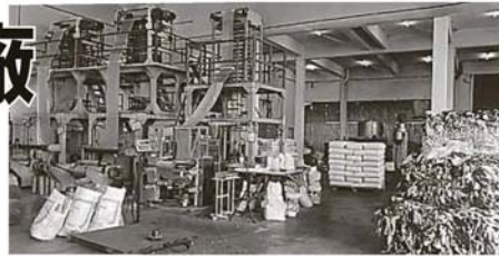
▲所有机器。市议会将会充公非法洋垃圾厂的

他说，据执法组初步调查显示，这些工厂不仅藏有大量的洋垃圾，还在没有向市议会申请执照的情况下操作，进行加工程序，违例行事。