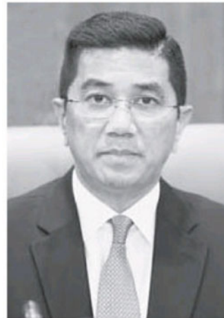
阿兹敏 ● 经济事务部长