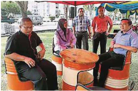
▲工业废料经过官员创意改造成休闲椅。