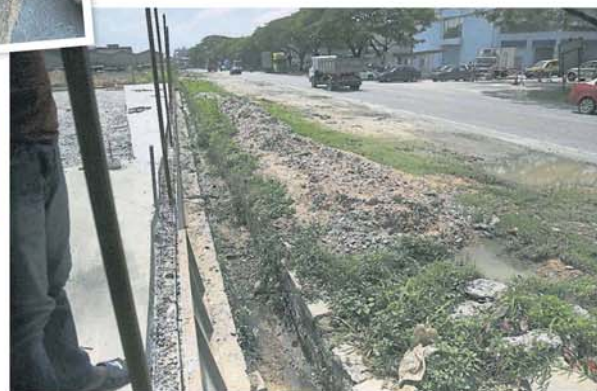
■溝渠積滿泥漿，以致下大雨時排水不及而發生突發水災。

水灾导致厂内三夹板和机器泡水，还要耗费时间和精力去清理工厂。工地業者沒妥善處理排水系統，以致黃泥和石頭阻塞溝渠，排水流入許多工廠。