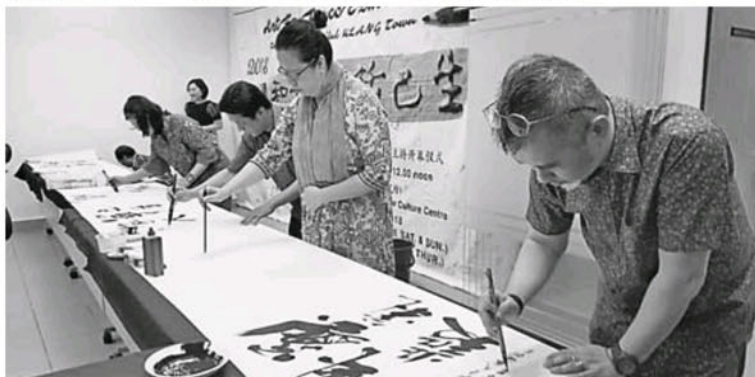
多位艺术家现场挥毫，让大家了解书画艺术之美。

他说，诚如国际创价学会会长池田大作所言“文化的力量也许不起眼，但能改变人心，所以是根本的力量”，文化和艺术能够启发和丰富人心，为他人带来幸福、勇气与希望。