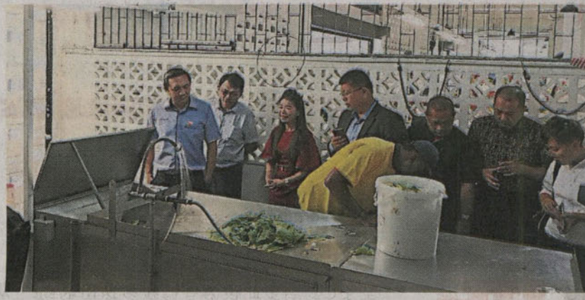
■贩酵素。巴刹内设有食物回收中心，小

他认为，威省市政局的Upcycle Park有值得学习的地方，不排除日后在雪州举办工作坊，让该市政局派员前来指导，以便州政府员工加入环保行列，改造更多的废物。（TKM）