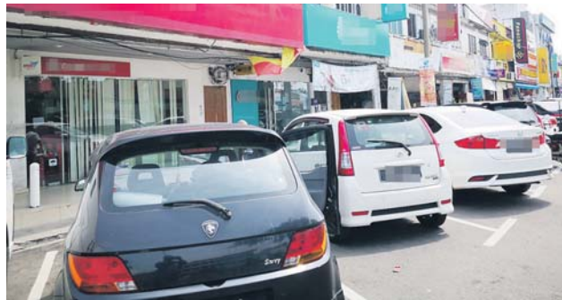
Kutipan caj parkir dijangka dilaksanakan di Pekan Sungai Besar, bermula tahun depan.

Majlis Daerah Sabak Bernam (MDSB) dijangka melaksanakan caj parkir di beberapa kawasan utama di daerah ini bermula tahun depan.