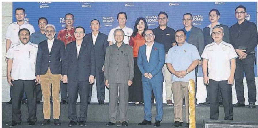
馬哈迪(前排中)推介“FundMyHome”創新產業平台；前排左起為阿都拉昔、拉惹峇林、林冠英、童貴旺、阿米魯丁及劉啟盛。

出席者包括財政部長林冠英、房屋及地方政府部副部長拿督拉惹峇林、雪州大臣阿米魯丁、綠盛世國際副主席丹斯里劉啟盛、主席丹斯里阿都拉昔，及The Edge媒體集團主席拿督童貴旺等人。