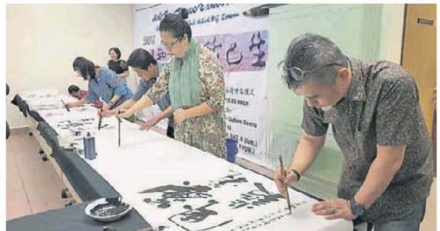
■ 多位艺术家现场挥毫，让大家了解书画艺术之美。