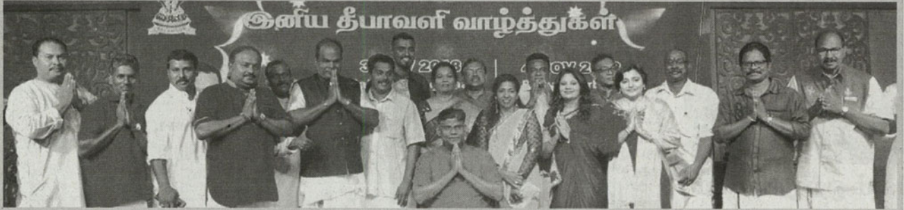
பொதுமக்களுக்கு தீபாவளிப் பெருநாள் வாழ்த்து கூறும் கணபதிராவுடன் பக்காத்தான் தலைவர்கள், பொது இயக்கத்தினர், கவுன்சிலர்கள், கிராமத்துத் தலைவர்கள்