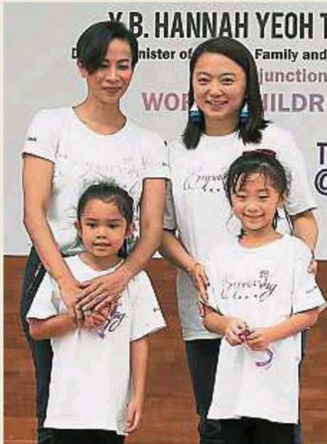
楊巧雙（后排右起）與莎麗娜主持“青年賦權·為社會做出改變”開幕儀式後合照。

（吉隆坡4日訊）婦女及家庭發展部副部長楊巧雙指出，希盟政府在2019年財政預算案中撥款1000萬令吉，為政府辦公室設立50所全新托兒中心，這對該部鼓勵更多職業女性繼續工作是個好的開始。